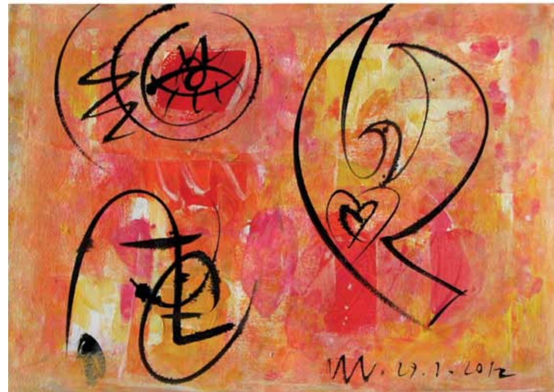
Visoka pesem, iz cikla Invokacije/Reminiscence , 2012. Akril in tuš na papir, 38 x 54 cm Song of Songs, from the cycle Invocations/Reminiscences. Acrylic and China ink on paper

Slikarjev likovno simbolni jezik je prepoznaven, zanj so značilni motivi angelov, ptic, src, poljubov, posebej ljube pa so mu podobe obrazov. Nekatera dela zadnjih let je poimenoval Invokacije/Reminiscence , gre za simbolne upodobitve klicanj, petja, molitve in spominjanja. Na teh delih se zvok klica oziroma pesmi kaže kot hieroglif srca pa tudi ptice-duha, včasih tudi v medsebojnem prepletu.