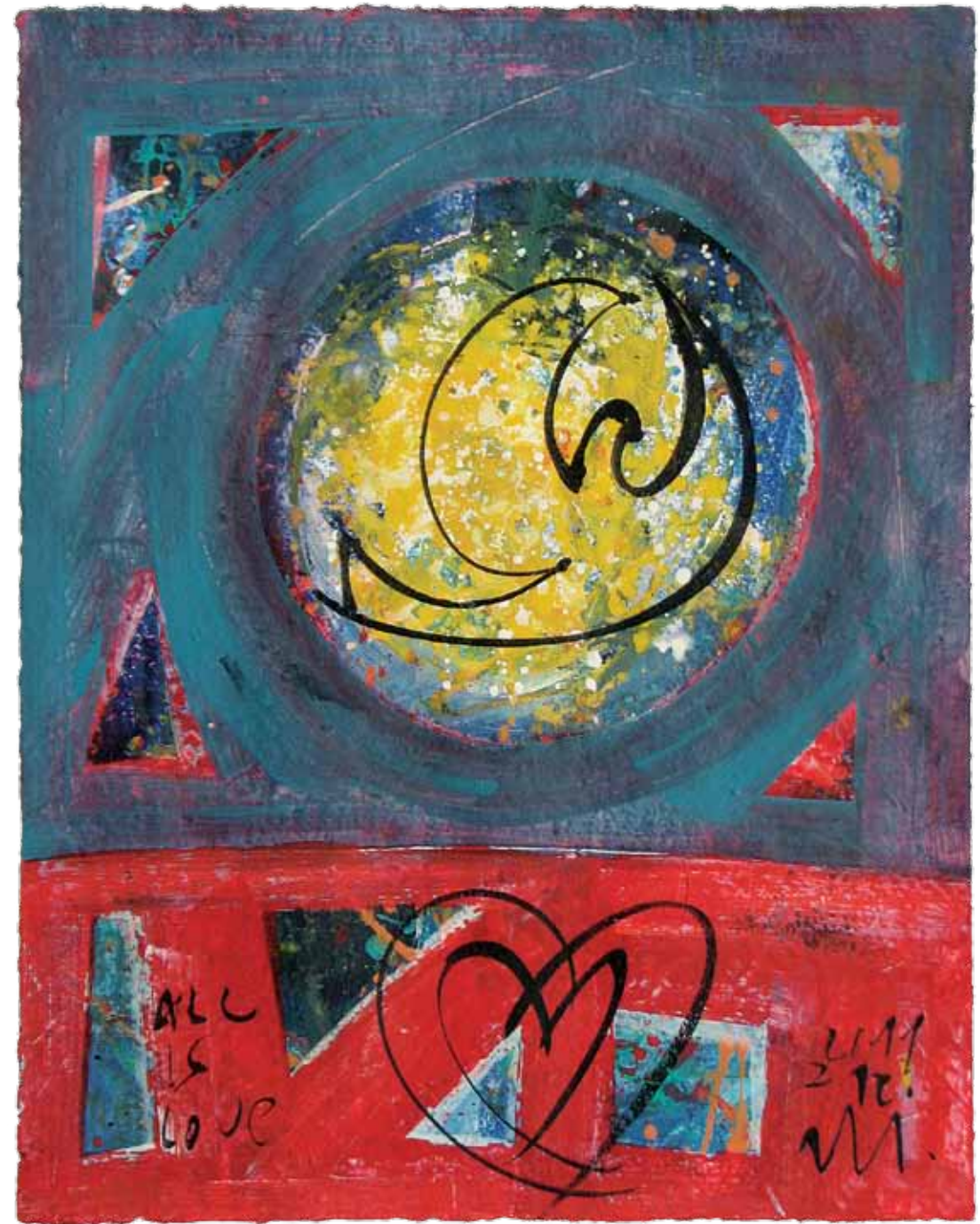
»All is Love«*, iz cikla Invokacije/Reminiscence , 2011. Akril in tuš na papir, 40,8 x 31,8 cm

Slikar išče navdih pri velikih mojstrih (Kandinski, Chagall, Matisse, Kregar ...), vendar mu njihova dela ne predstavljajo direktnega likovnega vzorca, ampak bolj izhodišče za razmislek o lastni ustvarjalnosti. Občuduje tudi način, kako sta svoje arhitekturne mojstrovine s slikarskimi in kiparskimi elementi krasila Plečnik in Le Corbusier. Ideje in razpoloženja črpa tudi iz plesa, literature in glasbe. Pri plesu naj omenim nekajletno ustvarjalno sodelovanje s plesalkami sodobnega plesa, navdihoval pa ga je tudi umetniški opus plesnega para Pie in Pina Mlakarja, s katerim se je slikar večkrat tudi osebno srečal. Glasbeni navdih sega vse od srednjeveške mistične koralne glasbe, ljubezenskega zanosa trubadurjev, preko Monteverdija in Bacha do Messiaena, Piazzolle, Arva Pärta, Philipa Glassa in pa glasbe, ki ga spremlja vse od gimnazijskih let (Pink Floyd, Bob Dylan in Leonard Cohen).