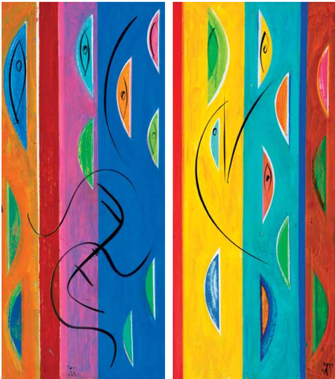
Visoka pesem II (diptih) / Poljub, Ptica Ljubezni, 2011 Akril na les, 111 x 49 cm. Song of Songs II (Diptych) / The Kiss, Bird of Love. Acrylic on wood