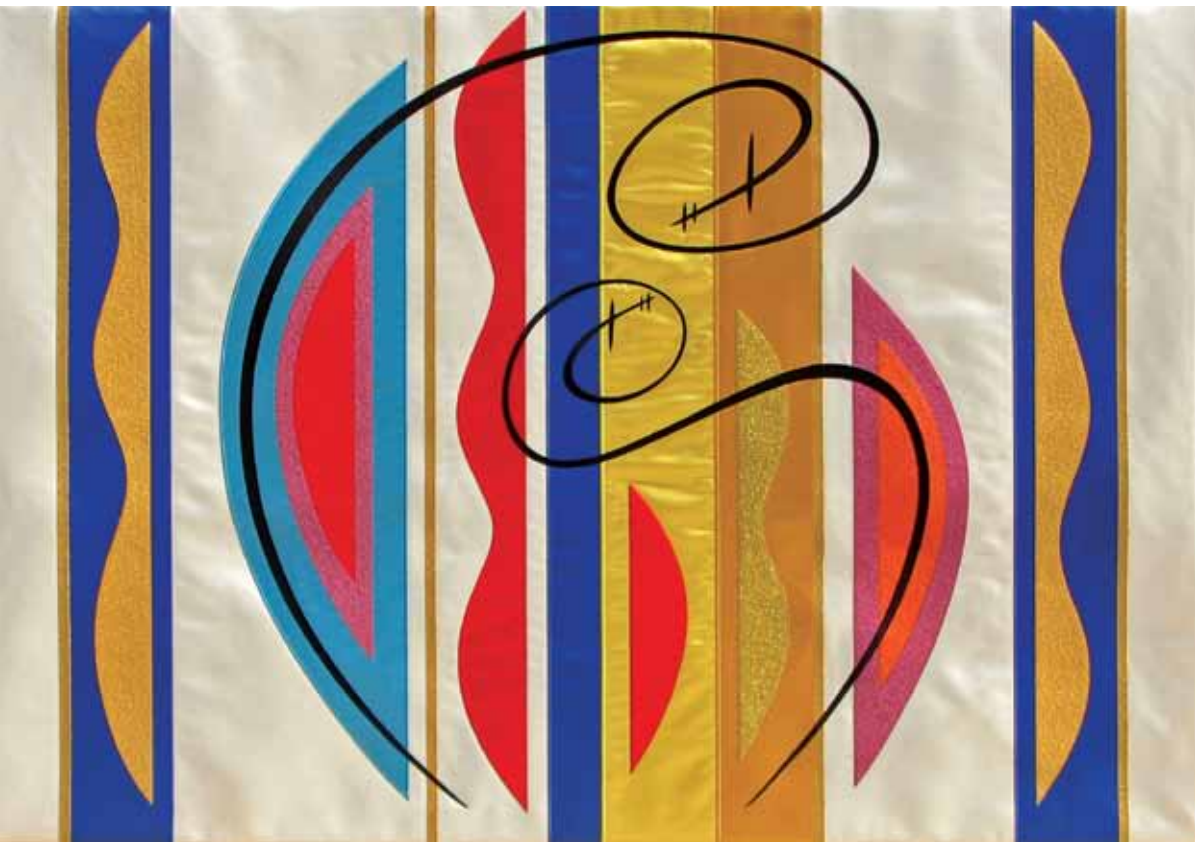
Marija z Detetom , 2009. Antependij, vezenje z aplikacijo, 100 X 144 cm Zunanji oltar pred baziliko Marije Pomagaj na Brezjah. Izvedba Vezenje Ercigoj , Ljubljana Virgin with Child. Embroidered Antependium on the new open altar at Brezje Basilica